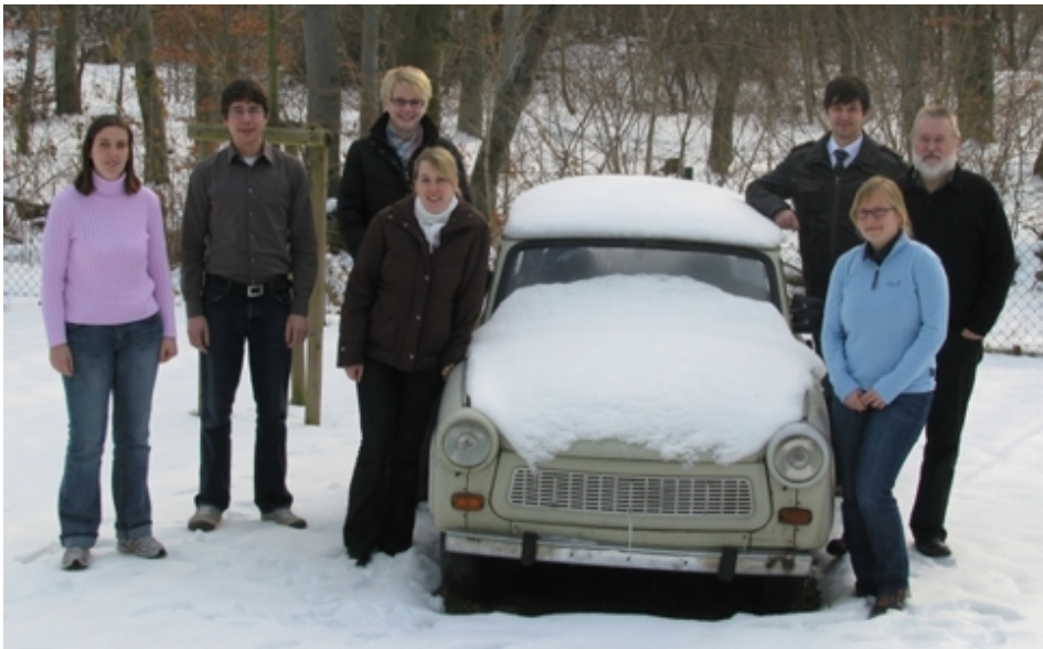
Teilnehmer des Studentenseminars

( https://mansci.ovgu.de/mansci_media/chronik/2010/daten/Ablaufplan+Dessau.pdf ) zum Thema "Operations Research im Health Care Management" in der Jugendherberge Dessau durch.