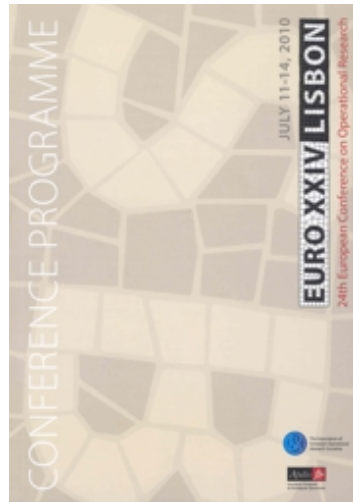
( https://mansci.ovgu.de/mansci_media/chronik/2010/daten/Program_EURO2010.pdf ) Titelseite des Programmheftes der EURO 2010