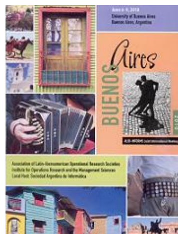
( https://mansci.ovgu.de/mansci_media/chronik/2010/daten/buenos_aires.pdf ) Titelseite des Programmheftes des ALIO-INFORMS International Meeting