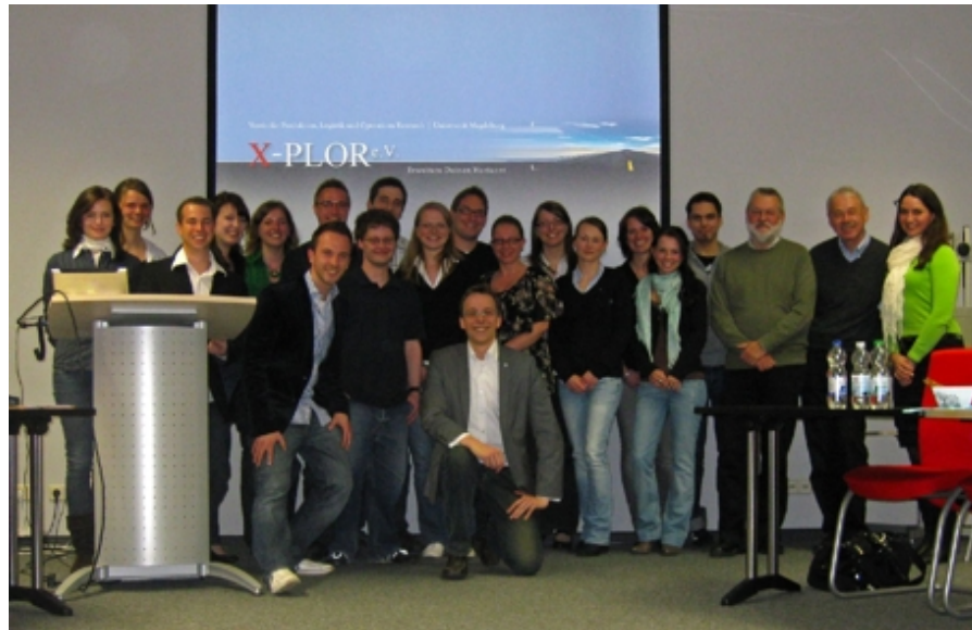
Teilnehmer der Gründungsversammlung