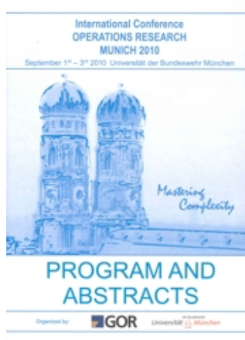
Titelseite des Programmheftes der OR2010