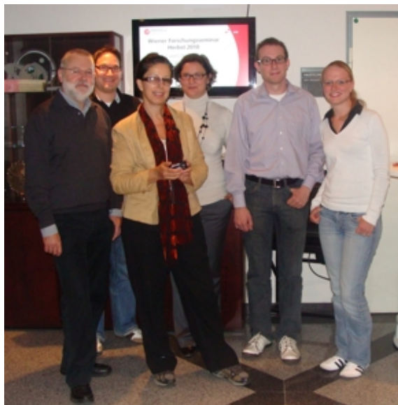
Teilnehmer des Wiener Forschungsseminars