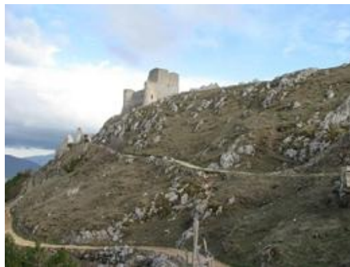
Tagungsort Sala Calesstiniana (oben), Rocca Calascio (unten)