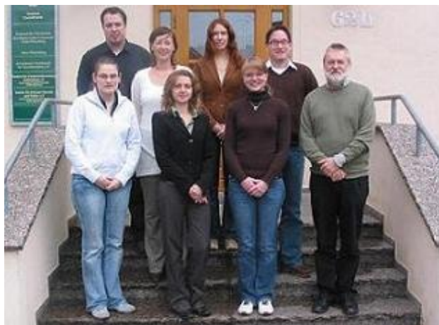
Teilnehmer des Studentenseminar

Am 17. und 18.1.2008 veranstaltet der Lehrstuhl "BWL VIII - Management Science" ein Seminar ( https://mansci.ovgu.de/mansci_media/chronik/2008/daten/seminar.pdf ) über "Moderne Heuristiken" für Studierende der Vertiefungsrichtung "Operations Research". Tagungsort ist die Leucorea, die alte Wittenberger Universität. Die Teilnehmer haben nicht nur die Möglichkeit, sich mit Methoden wie dem Attribute-Based Hill Climbing oder der Ant Colony Optimization vertraut zu machen, sondern auch die Lutherstadt kennen zu lernen, die schon seit einigen Jahren zum Weltkulturerbe der UNESCO gehört.