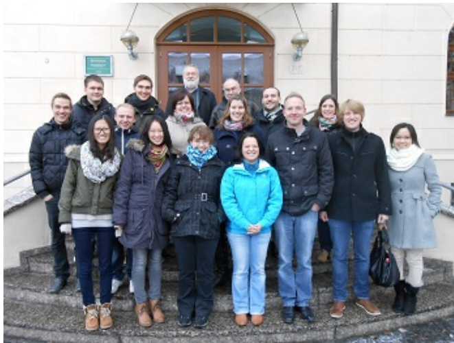
Teilnehmer des Studentenseminars

Vom 22.-25.1.2013 nimmt Professor Wäscher an einer Vorstandssitzung der EURO teil. Zu diesem Anlass übernimmt er das Amt c Präsidenten der EURO, das er bis Ende 2014 ausüben wird.