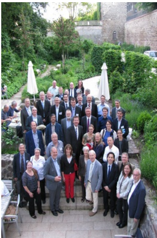
Teilnehmer des Festkolloquiums