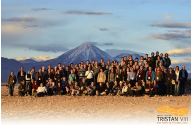
Konferenzteilnehmer vor dem Vulkan Licancabur