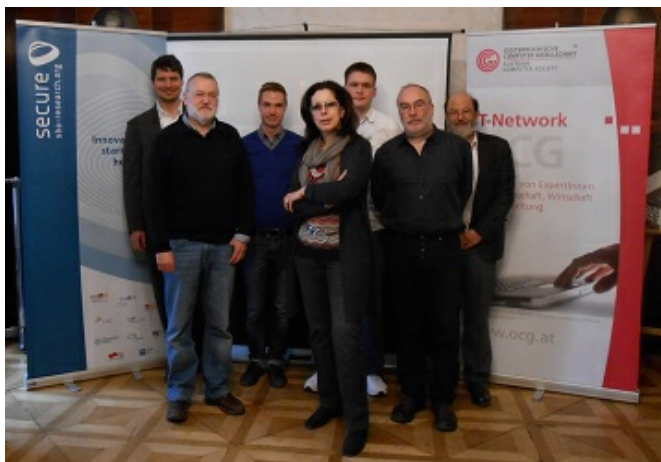
Teilnehmer des Wiener Forschungsseminars