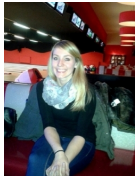
Teilnehmer der Lehrstuhl-Weihnachtsfeier