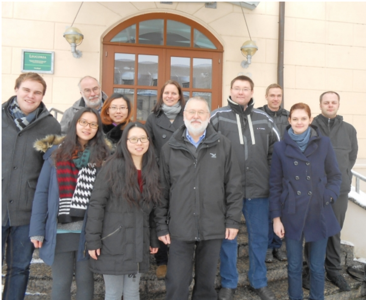
Teilnehmer des Studentenseminars

Am 23. und 24.1.2014 führt der Lehrstuhl in der Leucorea Wittenberg ein Seminar ( https://mansci.ovgu.de/mansci_media/chronik/2014/Daten/Ablaufplan.pdf ) zum Thema "Operations Research im Management von natürlichen Ressourcen" durch.