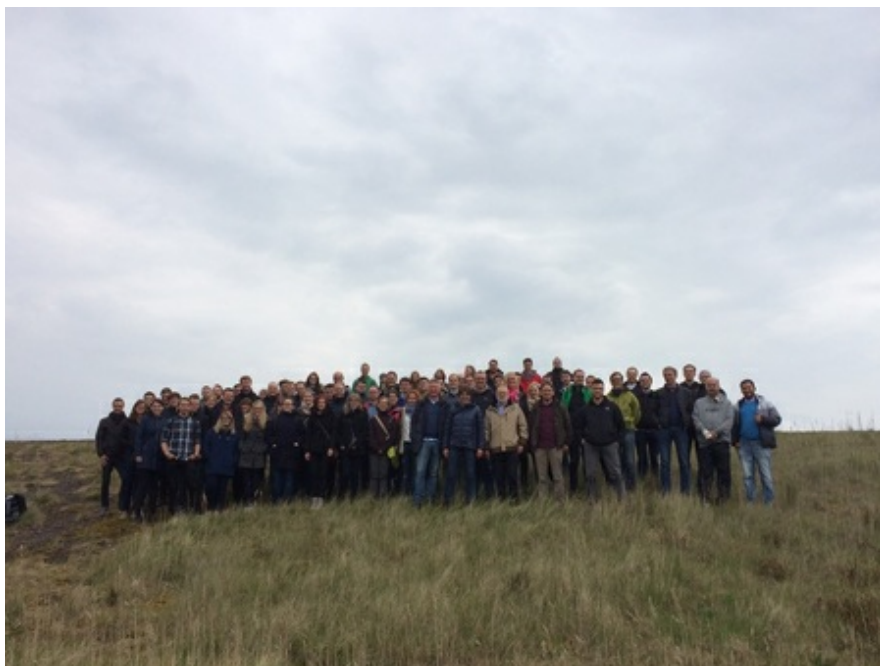
Teilnehmer des DoWoNo 2017 in Breklum