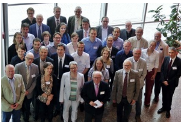
Teilnehmer des Festkolloquiums