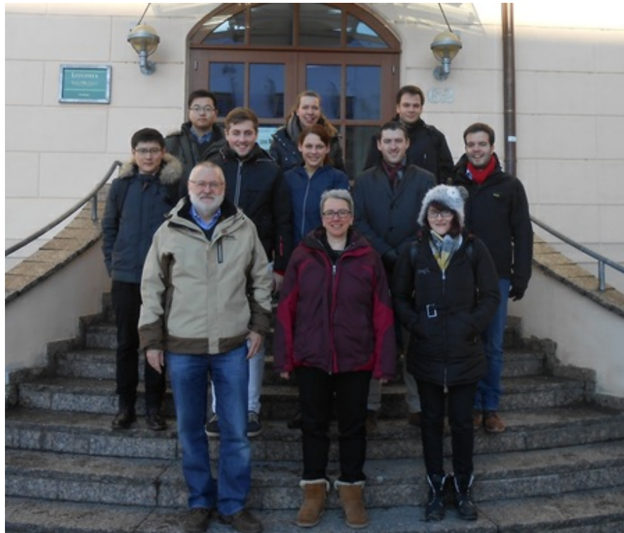
Teilnehmer des Studentenseminars

In diesem Jahr führt der Lehrstuhl das seit nunmehr fünf Jahren jährlich in der Leucorea in Wittenberg stattfindende › Studentenseminar ( https://mansci.ovgu.de/mansci_media/chronik/2017/Daten/OR_Seminar+2017-p-1776.pdf ) gemeinsam mit dem Lehrstuhl Operations Management durch. Am 20. und 21.01.2017 halten die Studierenden Vorträge über Problemstellungen aus den Bereichen des Bike Sharings und des Car Sharings.