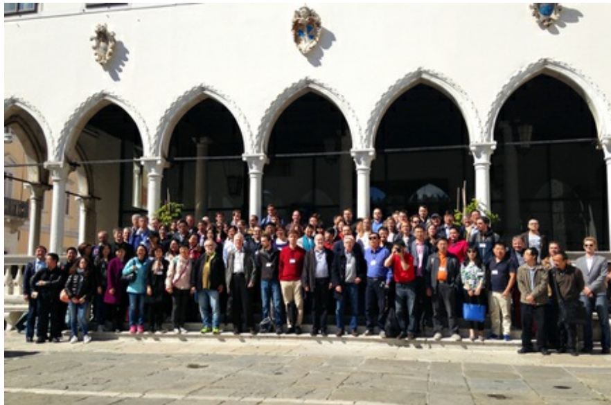
Teilnehmer an der Konferenz in Koper